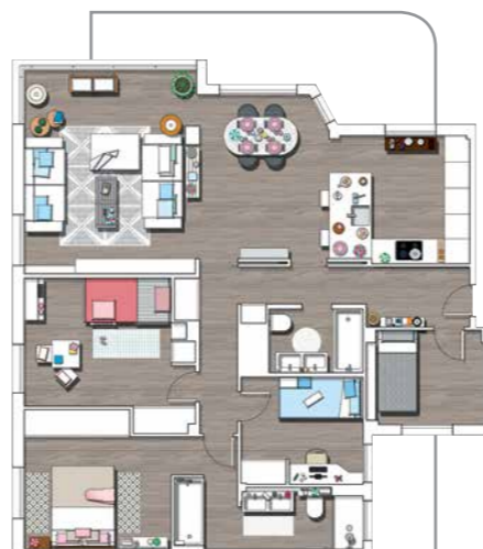
Los 120 m 2 de esta vivienda se distribuyeron en una gran zona común, con la cocina abierta al salón-comedor; cuatro dormitorios y dos baños. Además, tiene una terraza que, gracias a un cerramiento de puertas acristaladas, queda integrada en el interior siempre que se desea.

En este cuarto de baño, lavabos y sanitarios se organizaron en línea. El plato de ducha se ubicó al fondo, con una mampara de cristal que permite el paso de la luz. Las paredes se alicataron en blanco y el suelo se cubrió con la tarima oscura que reviste toda la vivienda.