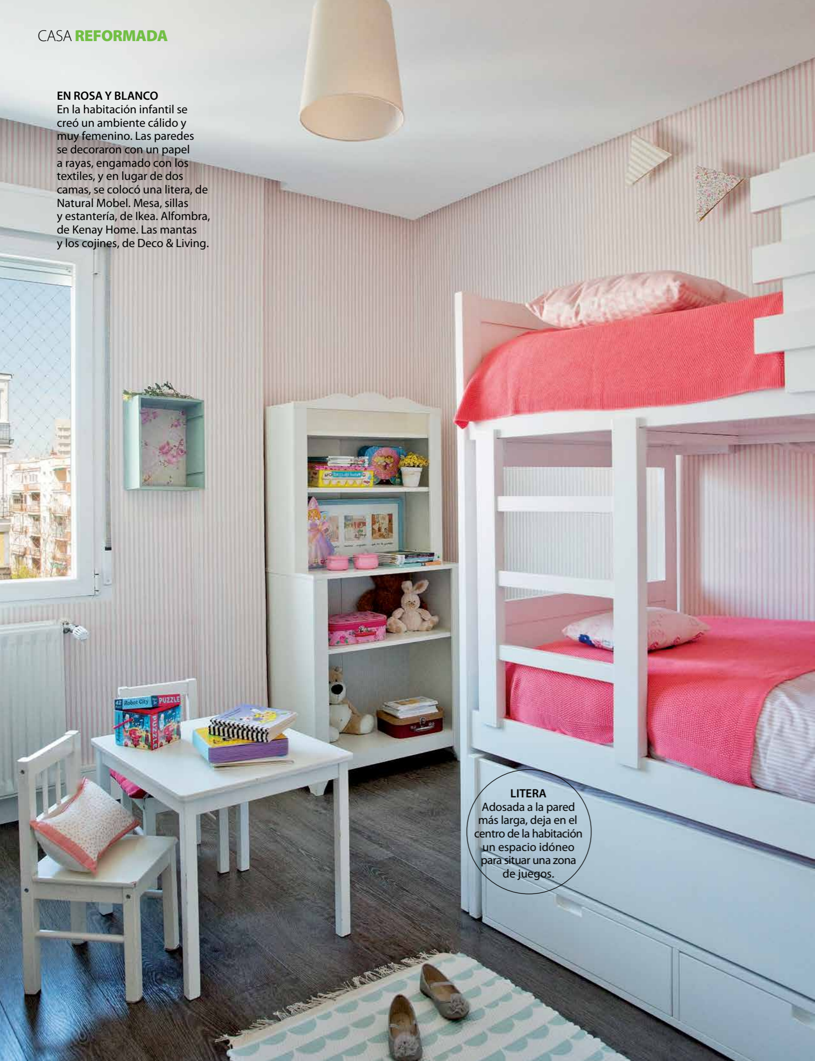
LITERA Adosada a la pared más larga, deja en el centro de la habitación un espacio idóneo para situar una zona de juegos.

En la habitación infantil se creó un ambiente cálido y muy femenino. Las paredes se decoraron con un papel a rayas, engamado con los textiles, y en lugar de dos camas, se colocó una litera, de Natural Mobil. Mesa, sillas y estantería, de Ikea. Alfombra, de Kenay Home. Las mantas y los cojines, de Deco & Living.